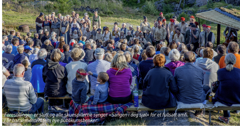
Forestillingen er slutt og alle skuespillerne synger «Sangen i deg sjøl» for et fullsatt amfi. I år har vi montert fem nye publikumsbenker.

Jernverkshelga 2015 er forlenget avviklet, og for 16. år på rad inviterte vi til kulturhelg blant jernverksruinene på Feiringåsen. Og denne 16. gangen kunne vi notere en formidabel publikumsrekord med hele 1 042 besøkende på de tre forestillingene av spillet «Menn av malm, jenter av jern». Fordelt på dagene var det 293 på fredag, 400 på lørdag og 349 på søndag. 293 besøkende på fredag var også ny premierekord. Den forrige premierekorden ble satt i fjor med 289 besøkende.