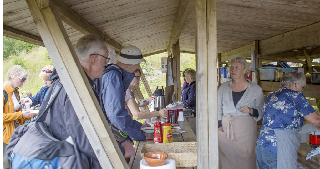
Feiring Jernverks Venner holdt matboden åpen gjennom tre dager i Jernverkshelga.

Vi vil derfor også takke vår medarrangør, Feiring Jernverks Venner, for det gode samarbeidet. Og vi retter en stor takk til alle skuespillere, musikere, regissør, billetttører, teknisk personale, parkeringsvakter, mange andre frivillige og grunneiere for deltakelse, hjelp og støtte.