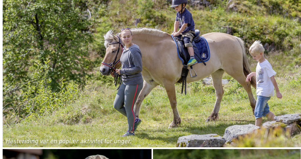
Hesteriding var en populær aktivitet for unger.