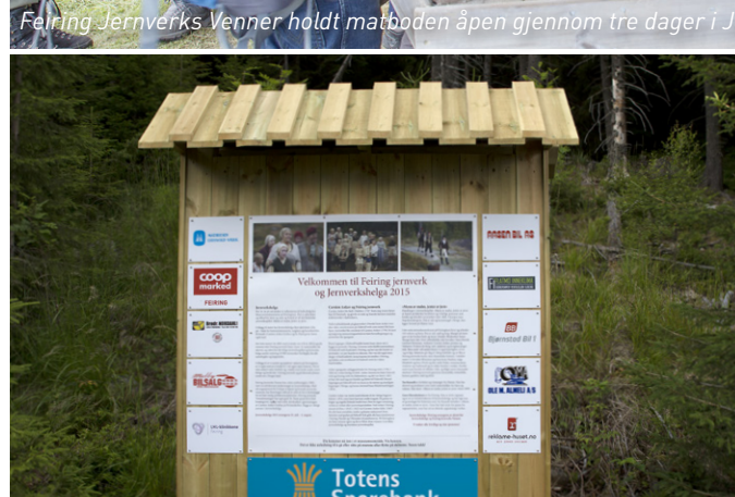
Sponsorene krediteres i programhefte og teaterprogram og på to nye infotavler ved inngangene til jernverket. Plassering av godkjent av Feiring jernverks Venner og Akershus museum.