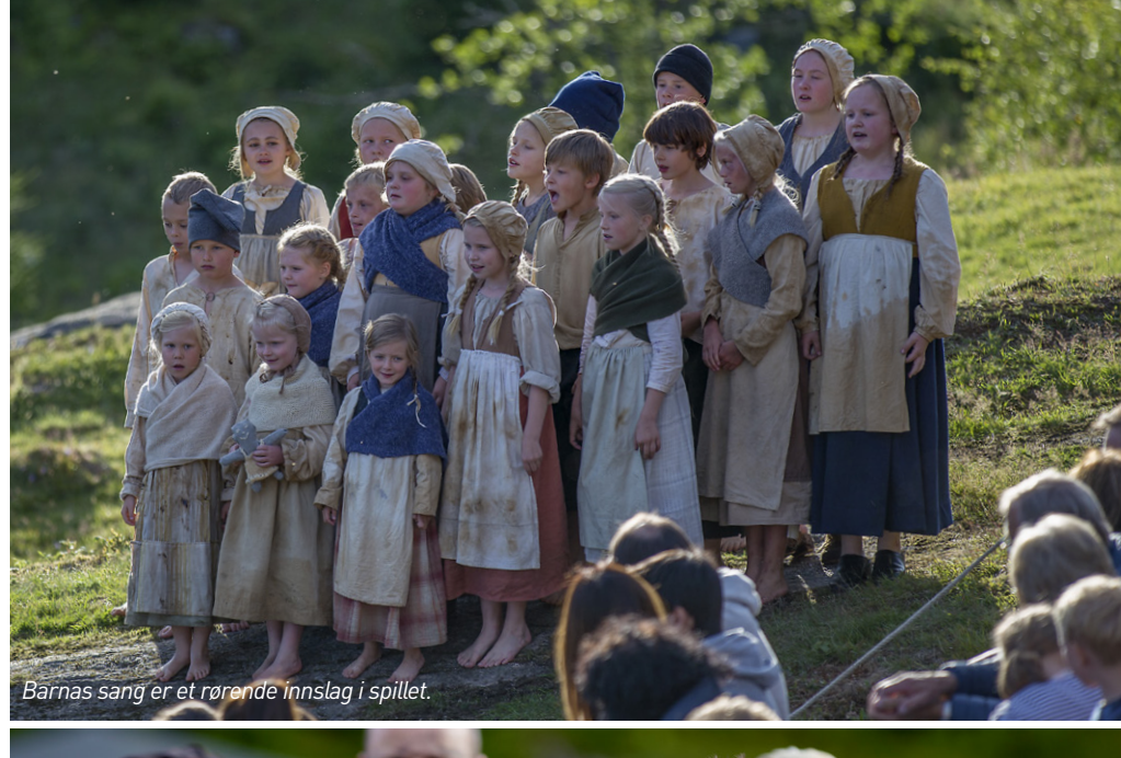
Barnas sang er et rørende innslag i spillet.

Mange publikummere ser spillet om igjen og om igjen, men samtidig opplever vi at publikum strømmer til fra et stadig større område, ja faktisk fra store deler av Østlandet.