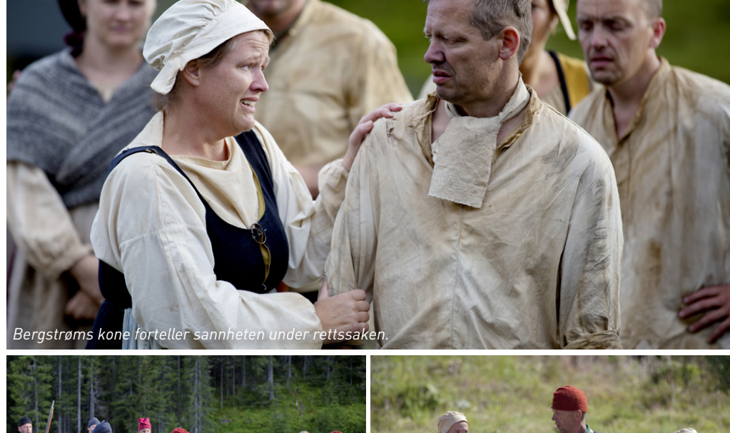
Bergstrøms kone forteller sannheten under rettssaken.