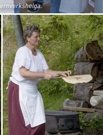
Flatbrødbaking på gammeldags vis.