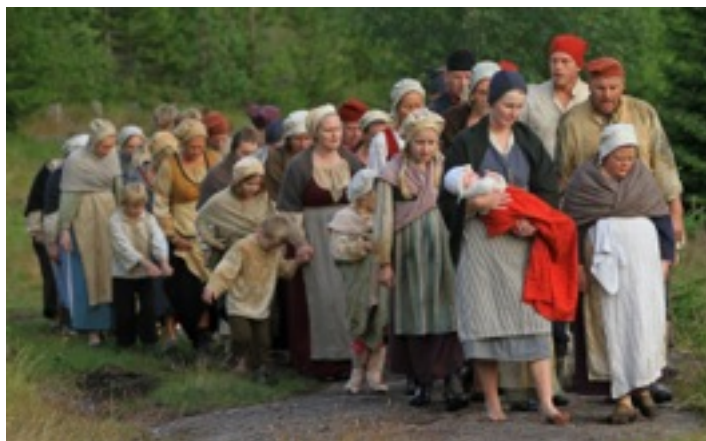
"Menn av malm, jenter av jern" (Jernverksteateret).